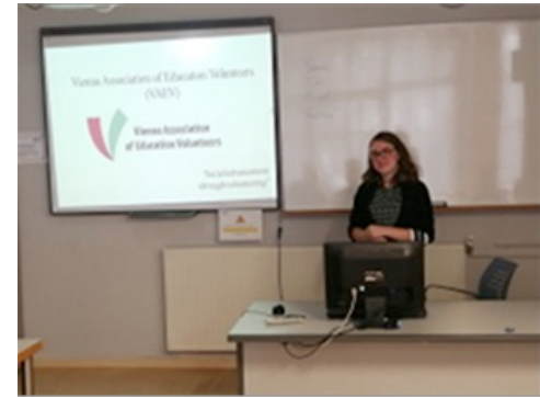
Vienna Association of Education Volunteers