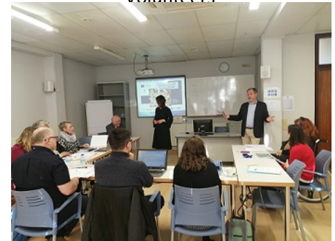
Fundación CESTE educación y empresa

De data voor de volgende partner-bijeenkomst zijn vastgesteld op 2 en 3 april 2020 in Wenen, Oostenrijk.