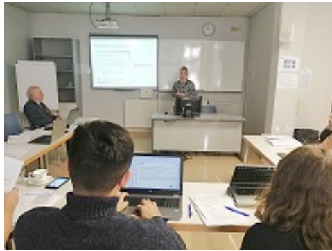
Momentum Educate and Innovate