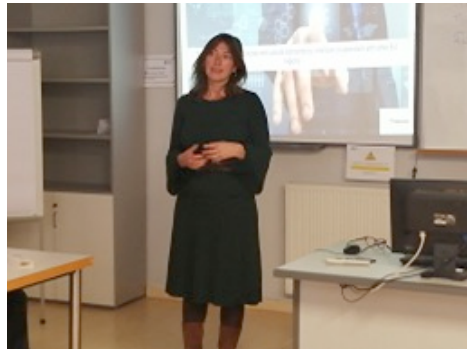
Soluciones Tecno-Profesionales Consulting